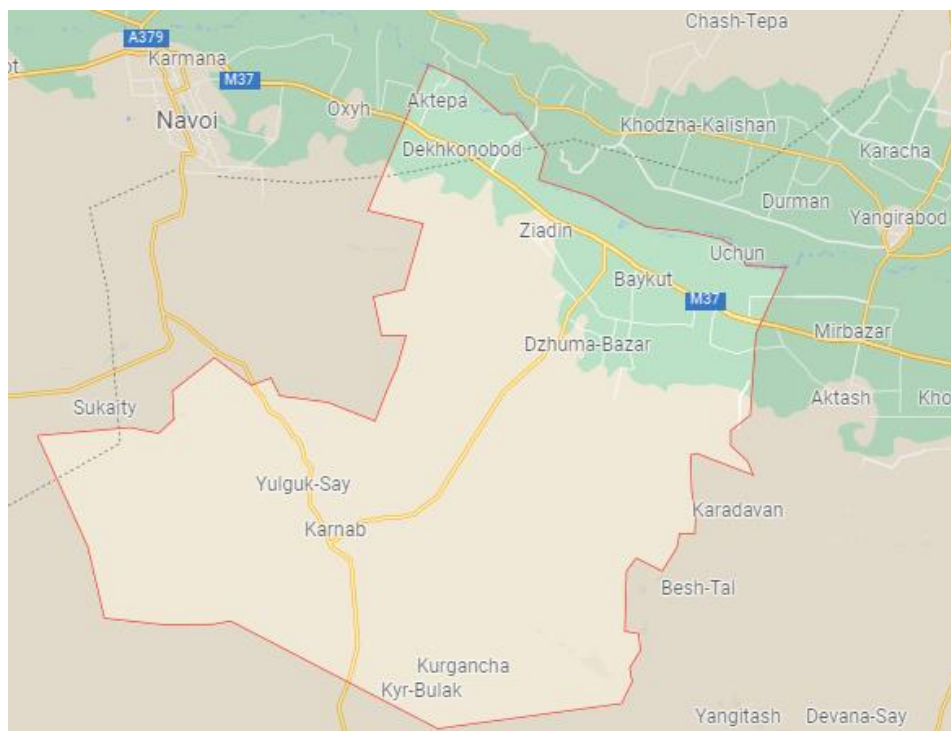
Пахтачи тумани харитаси.

Аҳолиси, асосан, ўзбеклар, шунингдек, рус, татар, қозоқ, тожик, қирғиз, украин ва бошқа миллат вакиллари ҳам яшайди. Аҳолининг ўртача зичлиги 1 км 2 га 107 киши.