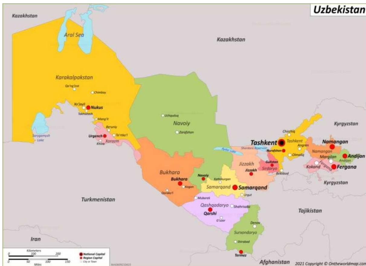
Рисунок 1: Область проекта